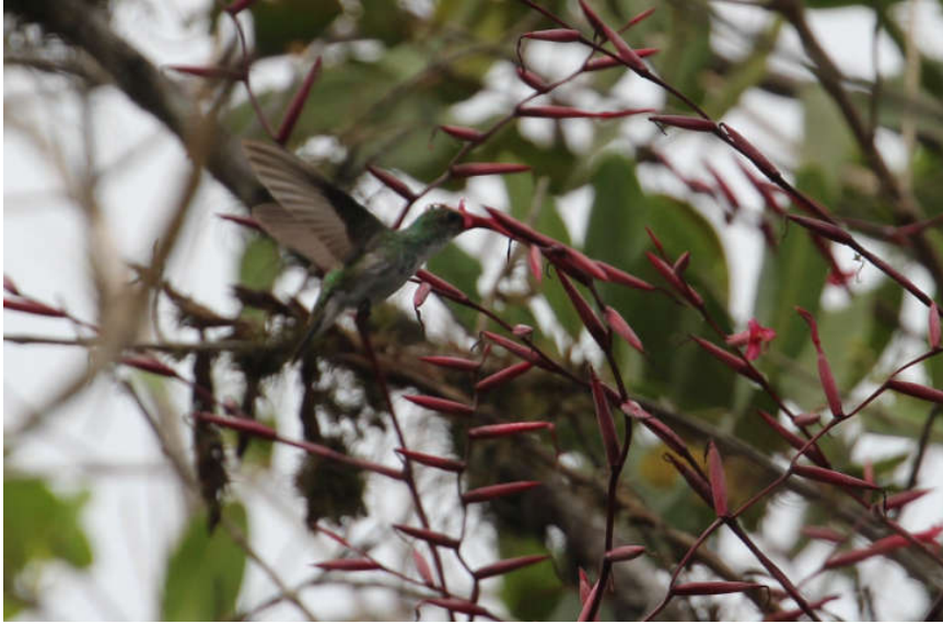
Figura 2. Amazilia manglera ( Amazilia boucardi ) alimentándose del néctar de flores de Tillandsia flexuosa , una bromelia epífita que crece en los manglares.