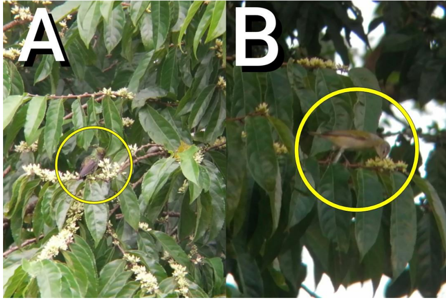
Figura 2. Amazilia boucardi y Leiothlypis peregrina alimentándose del néctar de las flores de Casearia arguta , Puerto Jiménez, Puntarenas, Costa Rica. A. Una hembra adulta de A. boucardi utilizando su pico para consumir el néctar de C. arguta , B. Un macho adulto de L. peregrina utilizando su pico para consumir el néctar.